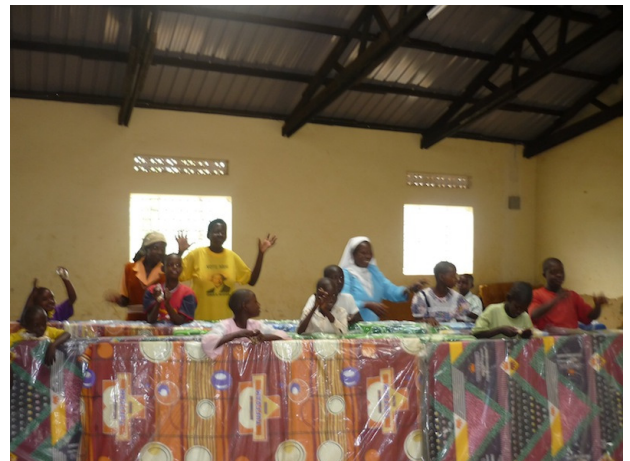
neun neue Matratzen

Anschließend machten wir noch die Fotos der Patenkinder, bevor wir zur Berufsschule St. Bruno in Mbarara führen. Insgesamt sechs Kinder haben bereits die Grundschule in Ntungamo erfolgreich beendet und absolvieren derzeit eine Ausbildung in der Berufsschule. Dort fotografierten wir die restlichen Patenkinder und ließen uns das Gelände sowie die Ausrüstung und Maschinen zeigen. In der Berufsschule absolvieren hauptsächlich Hörende eine Ausbildung. Da es in der Umgebung von Ntungamo keine spezielle Berufsschule für Gehörlose gibt, hat die Schulleitung kurzerhand entschlossen, auch gehörlose Schulabgänger aufzunehmen. Dort werden die Kinder besonders in Weben und Nähen beschult.