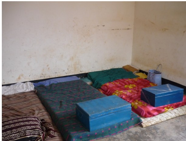
es fehlen Bettgestelle