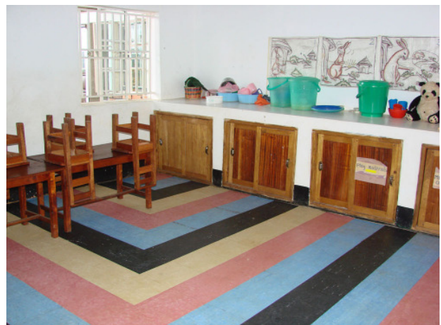
Klassenraum in der taubblinden Schule