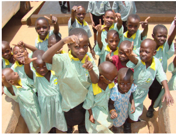
freudiger Empfang der Kinder

Nach einem lecker und geschmackvoll zubereiteten Essen von den Schwestern endete der erste Tag und wir fielen erschöpft ins vor Moskitos- geschützte Bett.