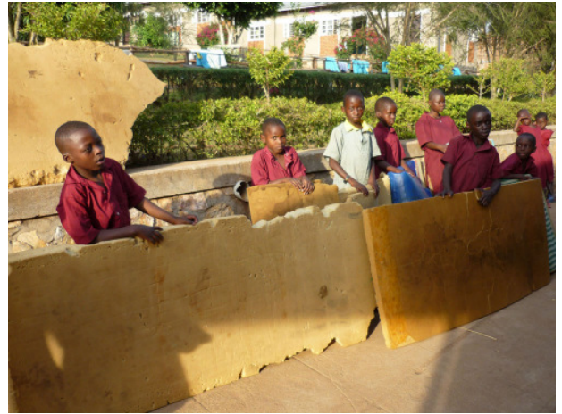
alte und verdreckte Matratzen in der Gehörlosenschule Masaka

neuen ersetzt. Die neun Kinder freuten sich nun endlich auf ordentlichen Unterlagen gut schlafen und träumen zu können.