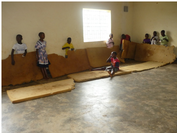
verbrauchte und verdreckte Matratzen in der Gehörlosenschule Ntungamo